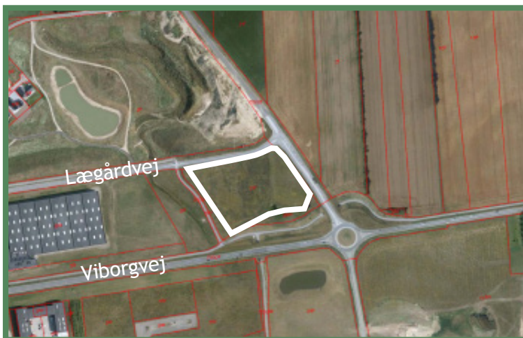
Kort a: Placering 1 ved Viborgvej (se hvid områdefgrænsning)

De skraverede områder angiver bymidten, eksisterende bydelscentre, lokalcentre og aflastningsområde Nyholm. Placering 1 og 2 er angivet på kortet.