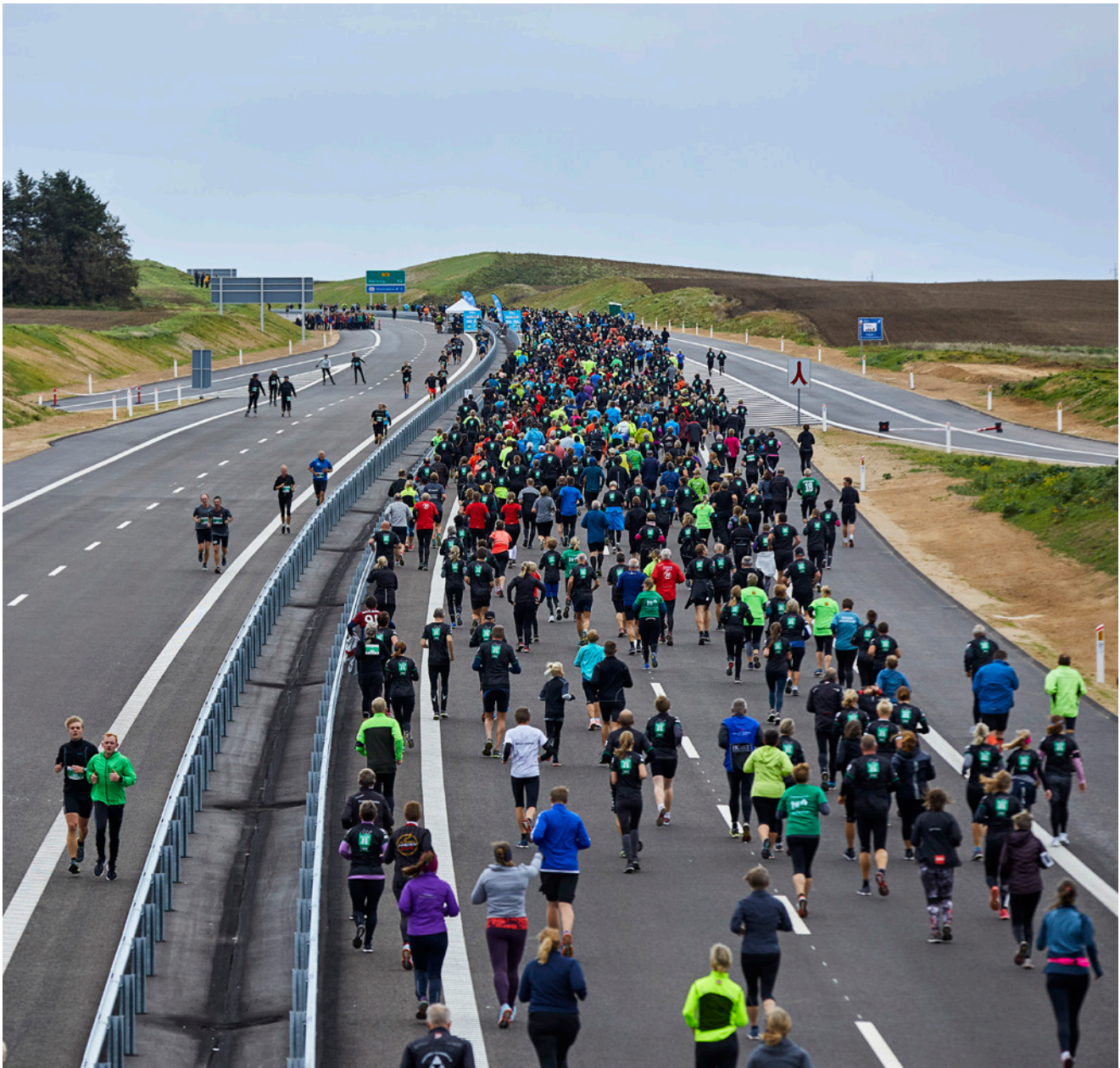
Vejfest i Vest